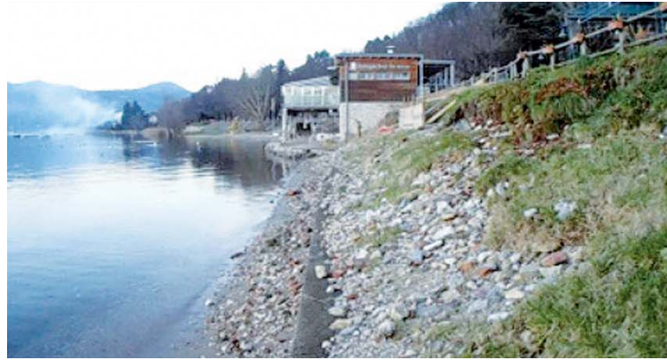
Argine viale Pietro Martire: stato di fatto

È stata approvata la convenzione con la parrocchia per sostituire i quattro quadranti dell'orologio del campanile della chiesa di Sant' Alessandro, con il costo di €13.346,80. L'orologio è di proprietà della parrocchia ma la possibilità per tutti di leggere l'ora è considerata fin dall'antichità un servizio pubblico a favore della Comunità; per consuetudine acquisita nei secoli è quindi un costo che si accolla il Comune. Attualmente si è in attesa delle autorizzazioni di Sovrintendenza Beni Archeologici e Paesaggio. L'intervento è previsto per il prossimo autunno.