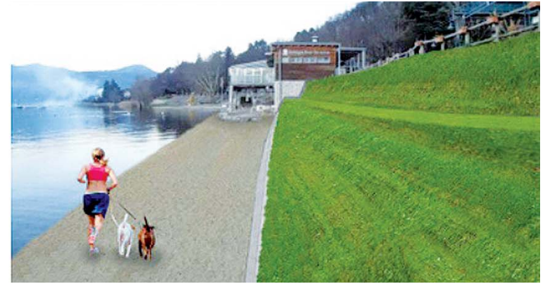
Simulazione fotografica dopo l'intervento sull'argine