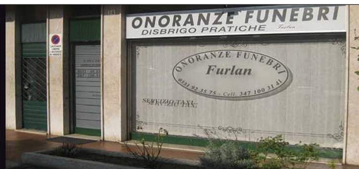
Sede di Sesto C. - C.so Matteotti, 14