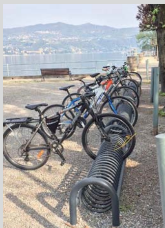
Rastrelliera per le biciclette all'imbarcadere (2.440 €, intervento concluso)