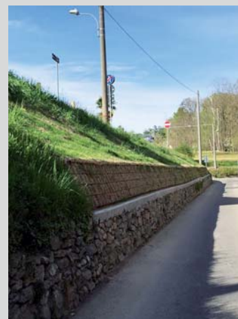
Massicciata con terra armata in via Cervino (8.000 €, intervento concluso)