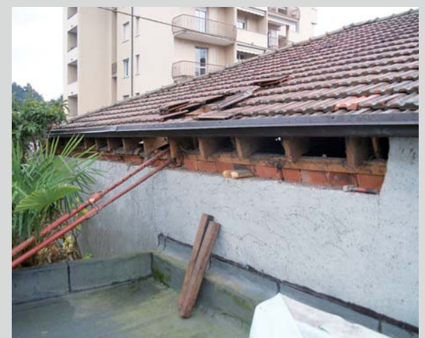
Rifacimento tetto della bocciofila (30.000 €, intervento concluso)