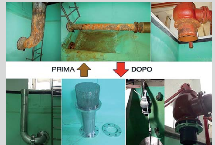
Interventi nei bacini dell'acqua potabile (28.500 €, interventi conclusi)