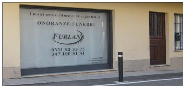
Sede di Taino - P.zza S. Stefano

In totale saranno impiegate 9 persone residenti ad Angera con reddito ISEE basso e problematiche varie.