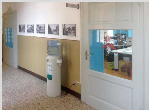
Vetri alle porte di tutti gli uffici comunali, più trasparenza, in tutti i sensi!