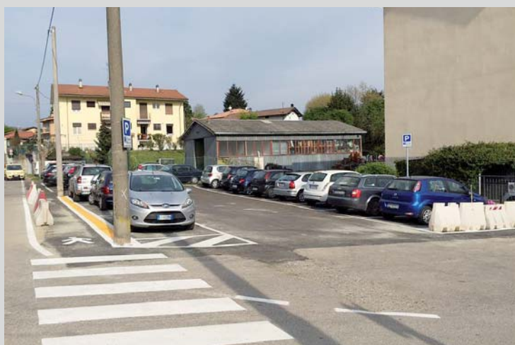
Parcheggio in via Monte Rosa (23.000 €, intervento concluso)