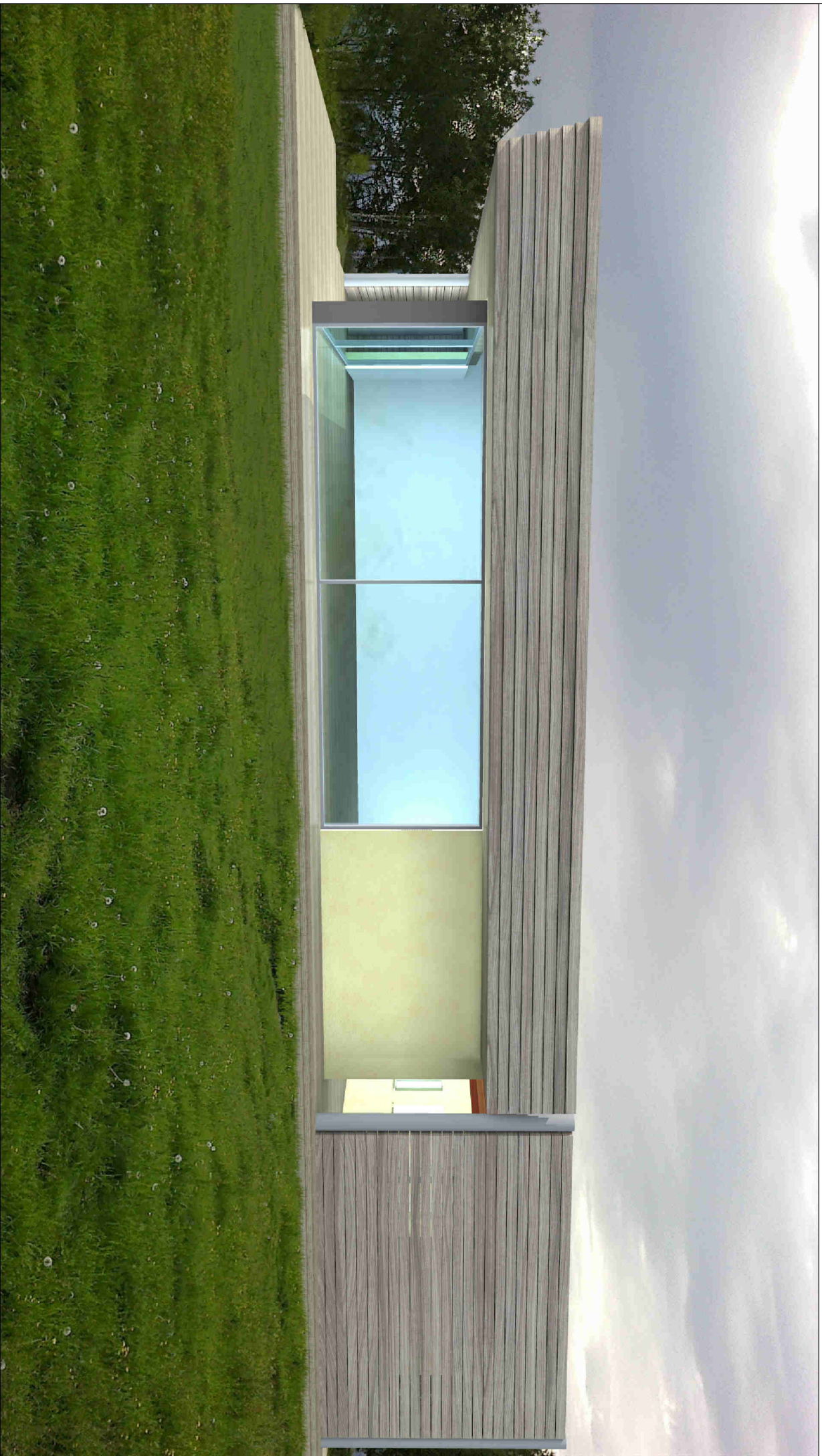
VISTA RENDERING - FRONTE INGRESSO PALESTRA