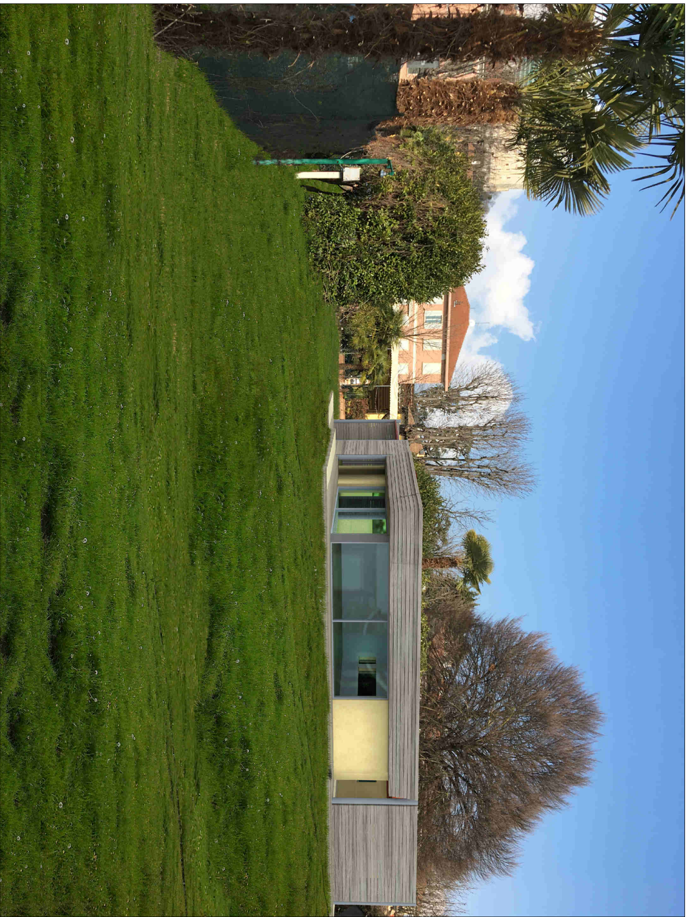
FOTOINSERIMENTO INTERNO AL LOTTO