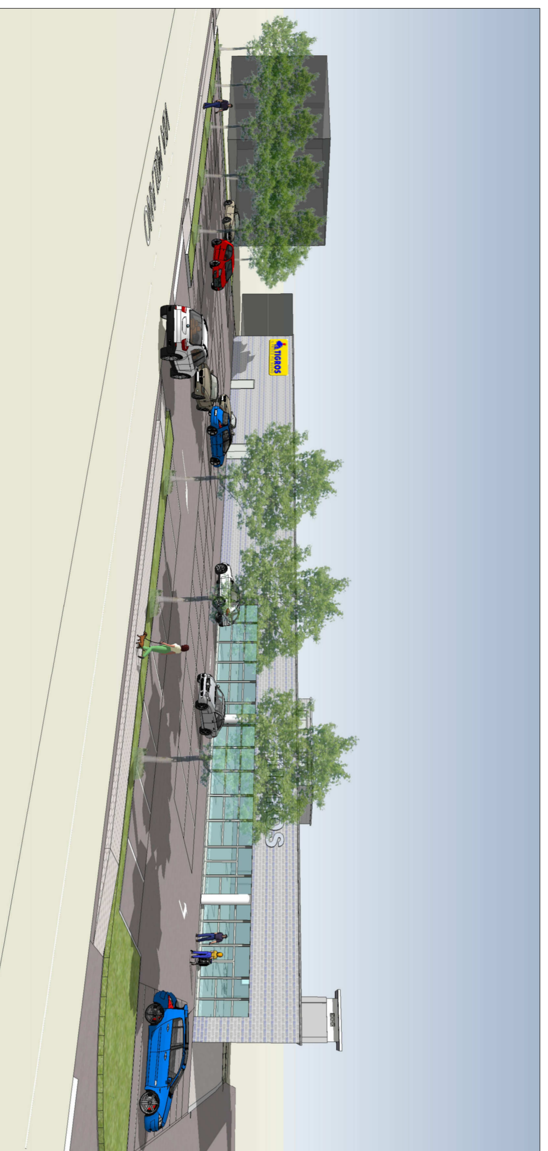
RENDERING N. 3