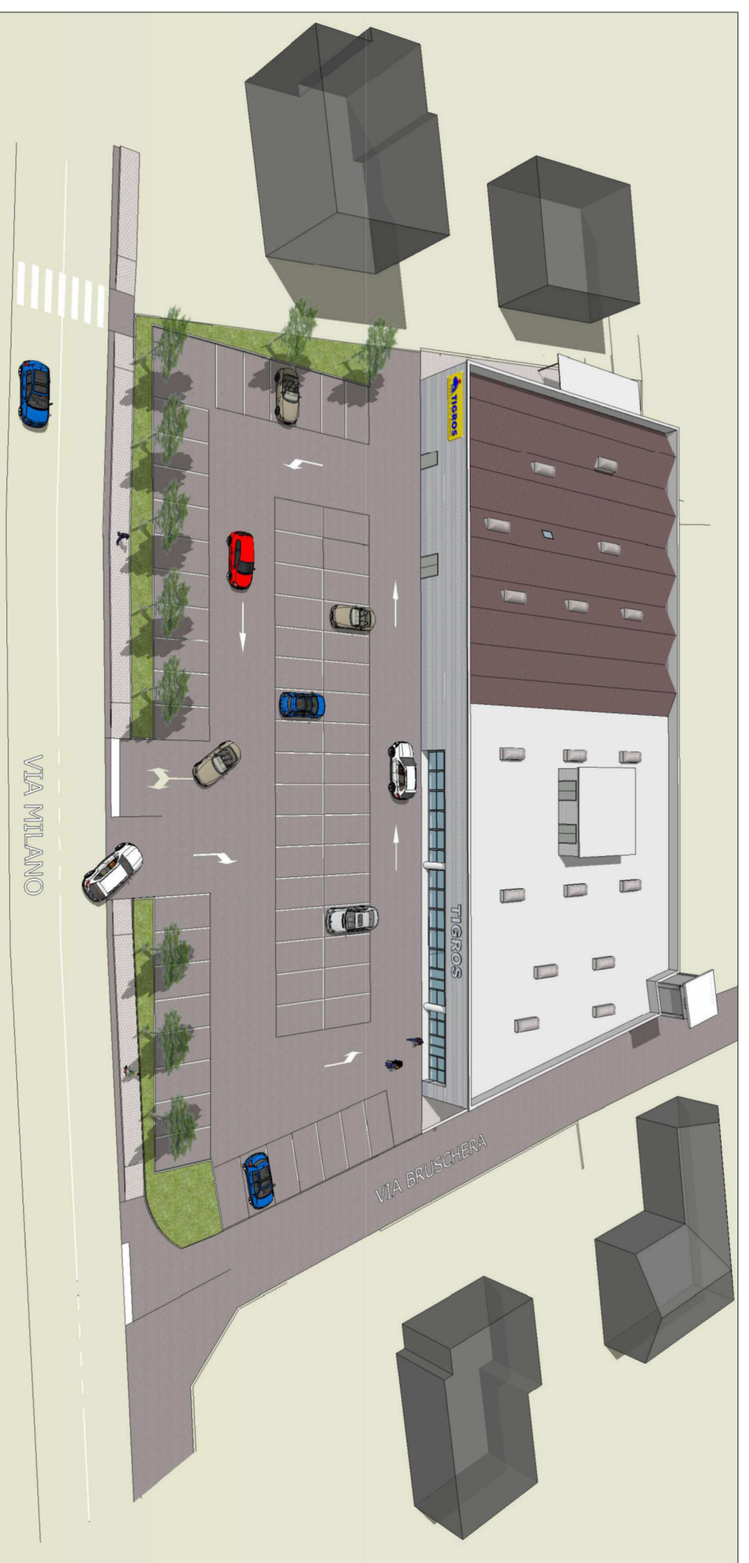
RENDERING N. 4