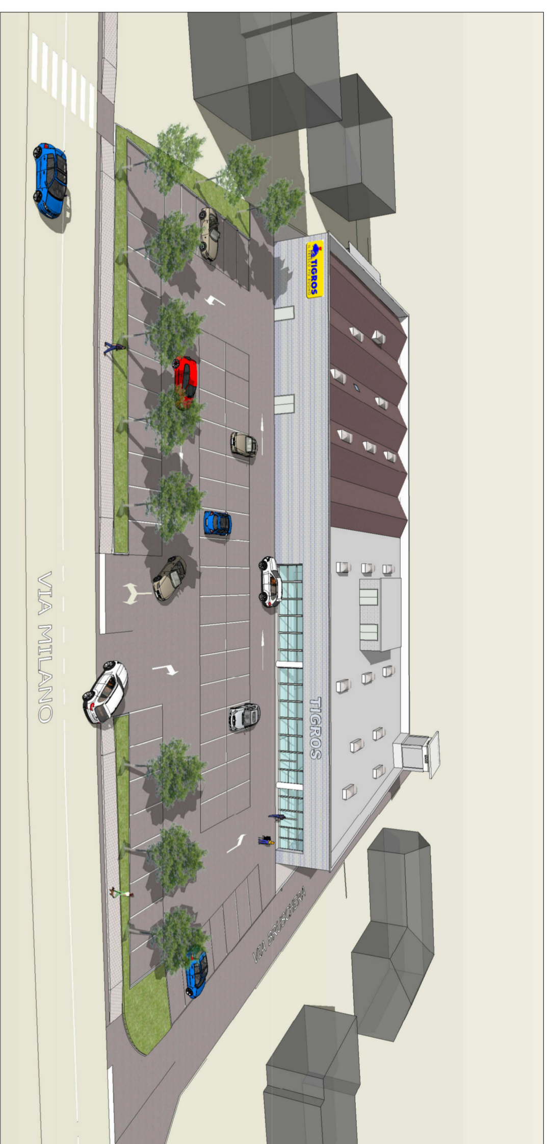
RENDERING N. 2