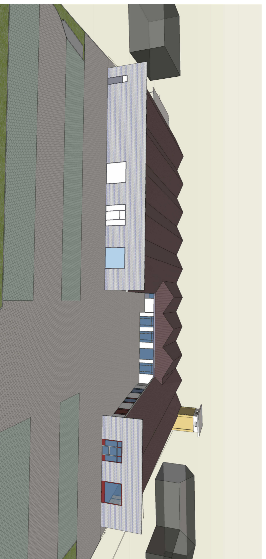
RENDERING N. 2