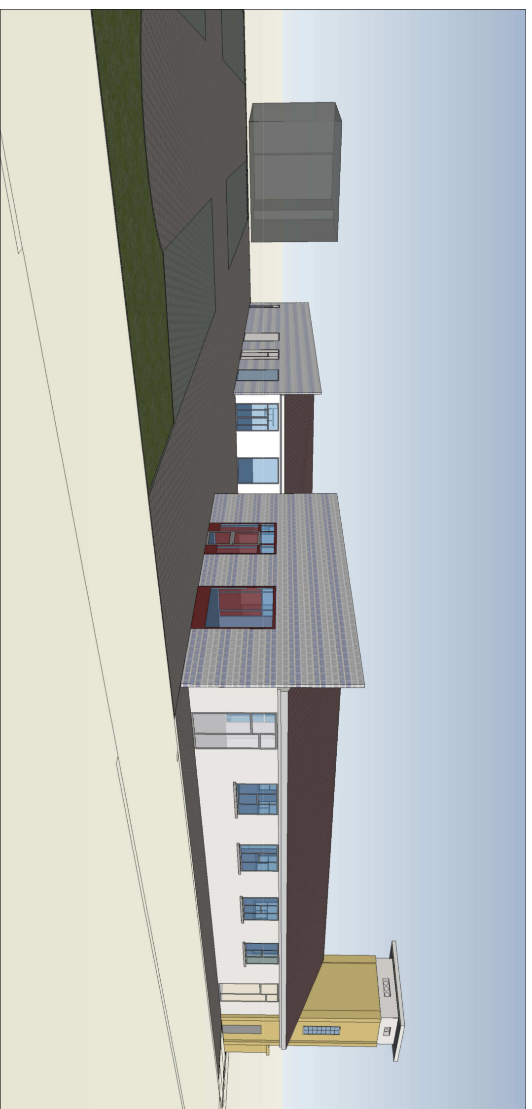
RENDERING N. 1