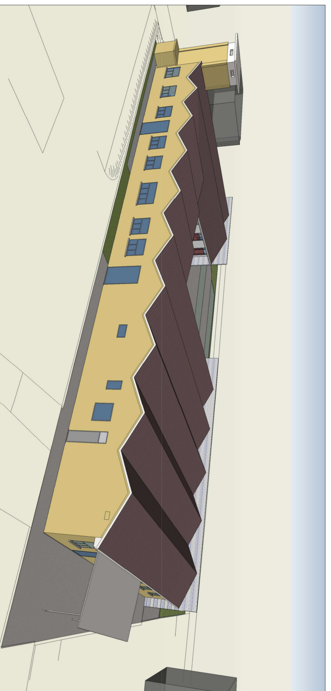
RENDERING N. 4