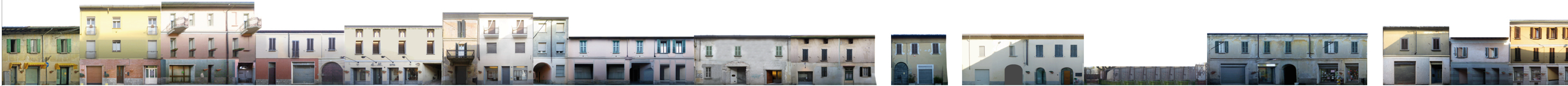
VIA GREPPI - lato NORD