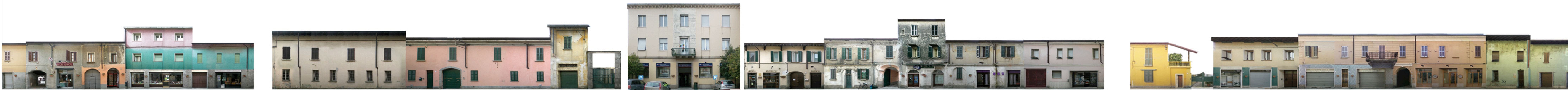
VIA GREPPI - lato SUD